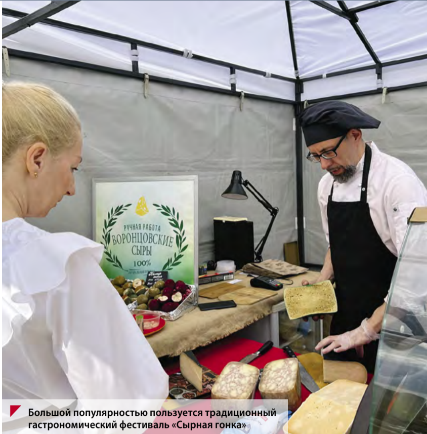
Большой популярностью пользуется традиционный гастрономический фестиваль «Сырная гонка»

Планируется строительство бизнес-парка «Степановское», что привлечёт 2,5 млрд рублей инвестиций и создаст новые рабочие места.