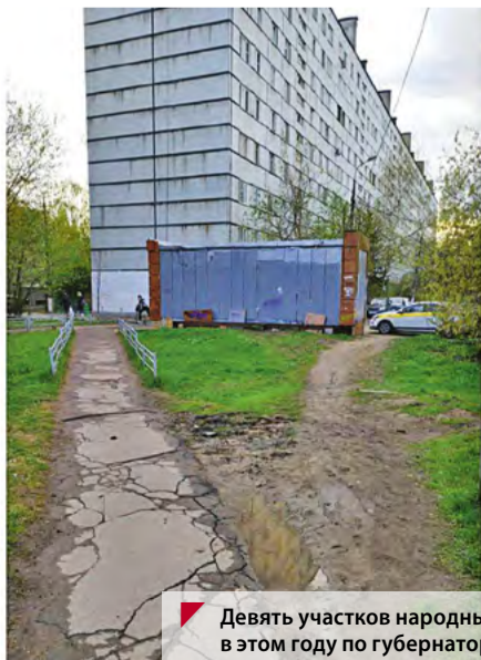
Девять участков народных троп отремонтировано в этом году по губернаторскому проекту «Пешком»

Разумеется, социальная инфраструктура включает в себя не только школы и детсады. Здравоохранение – не менее важная сфера, которой также уделяется особое внимание. Вот почему уже этой осенью в «Ильинских лугах» планируется начать строительство поликлиники на 400 мест.