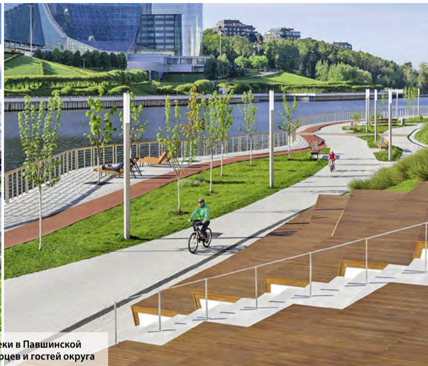
Благоустроенная набережная Москвы-реки в Павшинской пойме – одно из любимых мест красногорцев и гостей округа